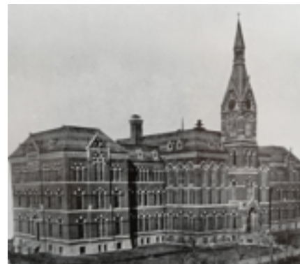
Nya Concordia Seminary

Seminarier växte och år 1849 blev Walther direktor där med ansvar för hela undervisningen. Själv undervisade han i dogmatik. Dessutom var han under flera perioder Missourisyndodens preses. Han gav från början ut kyrkans största tidning "der Lutheraner" och tio år senare den teologiska månads-tidskriften "Lehre und Wehre", där Walther skrev det mesta själv. Det var djupgående teologiska artiklar och en världsvid utblick över samtiden, där också t.ex. situationen i Sverige behandlades då och då.